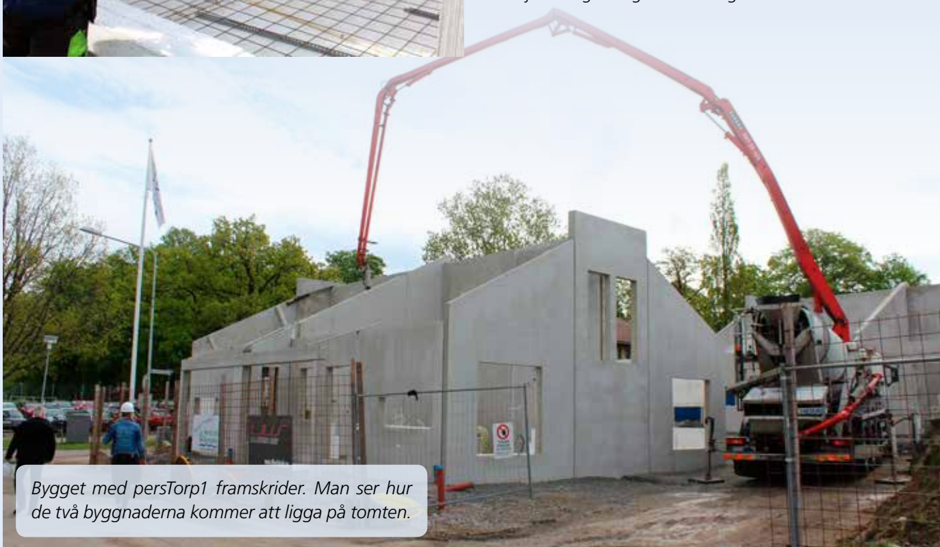
Bygget med persTorp1 framskrider. Man ser hur de två byggnaderna kommer att ligga på tomten.

EG Bygg i Vinslöv bygger med en egen patenterad metod. Fasaden är helt i betong och lägenheterna kommer att ha en mycket låg energiförbrukning.