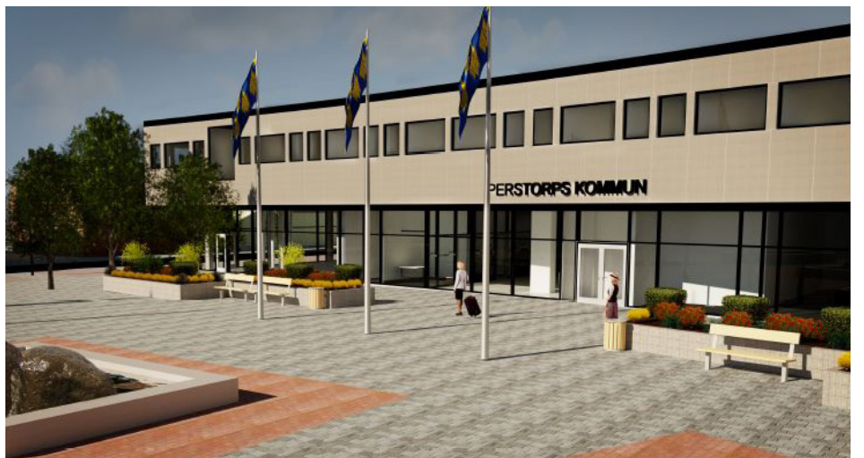
Exempelbilder framtagna av A-konsult i Helsingborg.