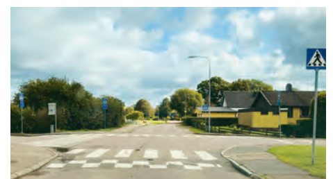
Korsningen/vägbulan på Stockholmsvägen/Spårväggsgatan ska ändras så den upplevs mjukare.