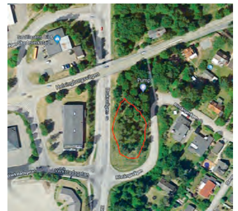
I området mellan Bruksvägen/Röstångavägen ska ett dagvattenmagasin byggas så dagvatten kan fördröjas vilket avlastar ledningsnätet.

- Ja, vi har ett par trafiksäkerhetsåtgärder på gång. Bland annat ska vi förbättra för gångtrafikanter som passerar över övergångsstället på Stockholmsvägen/Postgatan. Övergångsstället ska höjas upp så det blir en kombinerad fartbula. Som det är idag är det i stort sett ingen bilist som håller gällande 30 kilometer i timmen på sträckan. Under oktober är det även planerat att vägbulan i korsningen Stockholmsvägen/Spårväggsgatan ska åtgärdas så den upplevs mjukare för bilister att passera. Dessutom ska vi bygga ett dagvattenmagasin i området mellan Bruksvägen/Röstångavägen där dagvatten kan fördröjas så ledningsnätet avlastas.