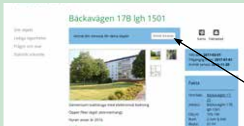
Genom ett par snabba klick kan du anmäla ditt intresse för en specifik lägenhet.

Adressen är inte så svår att komma ihåg: www.perstorpsbostader.se