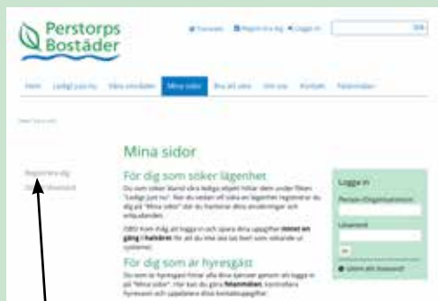
Första gången du kommer till Mina sidor, oavsett om du vill bli eller redan är hyresgäst, måste du registrera dig.