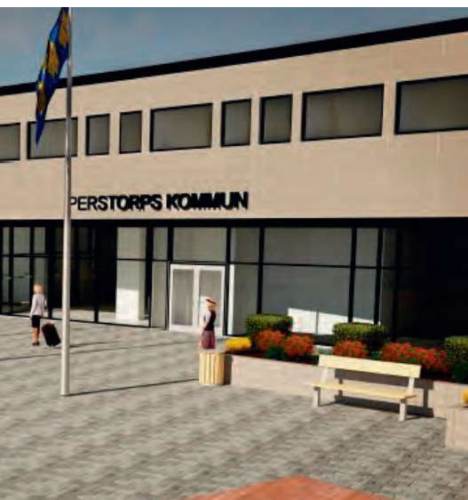
Exempelbilder av A-konsult i Helsingborg som visar hur Perstorps kommunhus kan komma att se ut efter renovering. Ansvarig arkitekt är Nina Merheim Stranne, 3D-illustratör är Isabelle Landin.