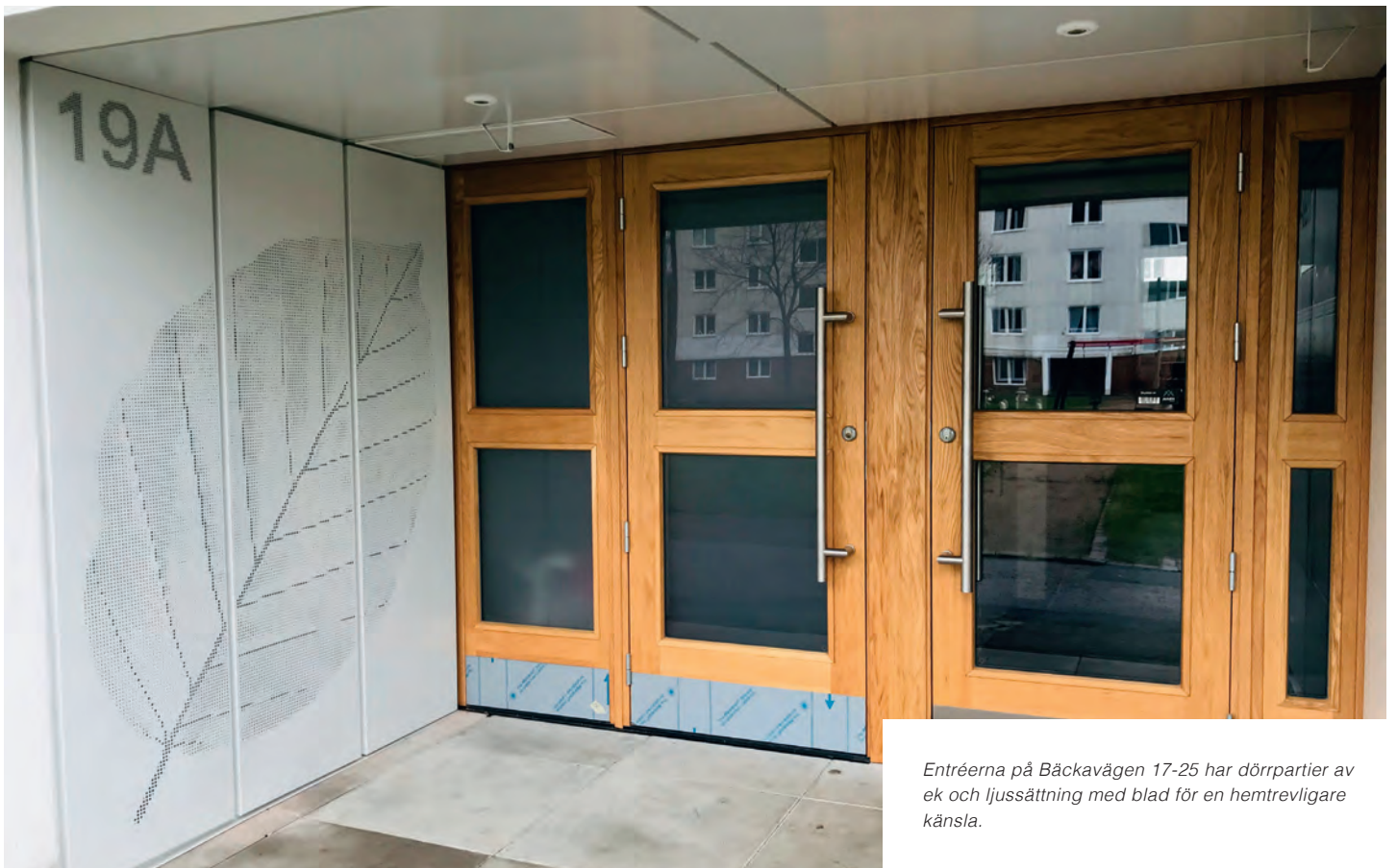
Entréerna på Bäckavägen 17-25 har dörrpartier av ek och ljussättning med blad för en hemtrevligare känsla.