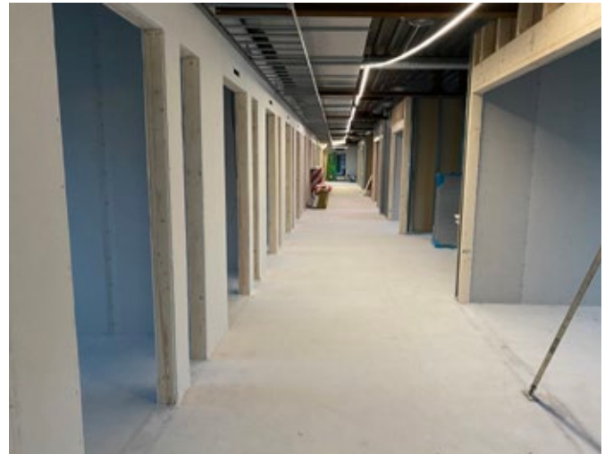
Rum och väggar tar form.

händelser/problem upp. Projekt Centrumhuset är inget undantag.