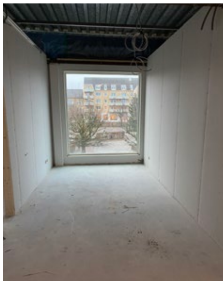
Nya och större fönster öppnar upp för ljusinsläpp från torget utanför.

För tillfället är cirka 20-30 personer igång på plats och jobbar men enligt Skanska är det åtskilligt fler som på ett eller annat sätt är med i renoveringsarbetet.