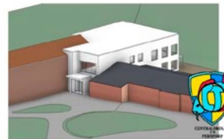
VY FRÅN SÖDER