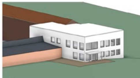
VY FRÅN ÖST