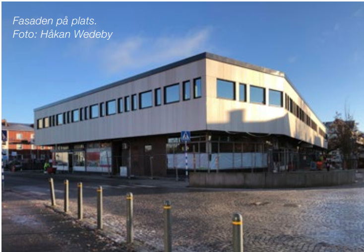
Fasaden på plats.