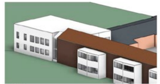
VY FRÅN VÄST