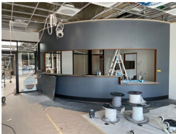
Centrumhuset håller fortfarande tidsplanen och kommunens lokaler beräknas vara klara i slutet av året. Bilden visar receptionsdisken i kommunens nya kundtjänst som passande nog har det klassiska virvarmönstret.